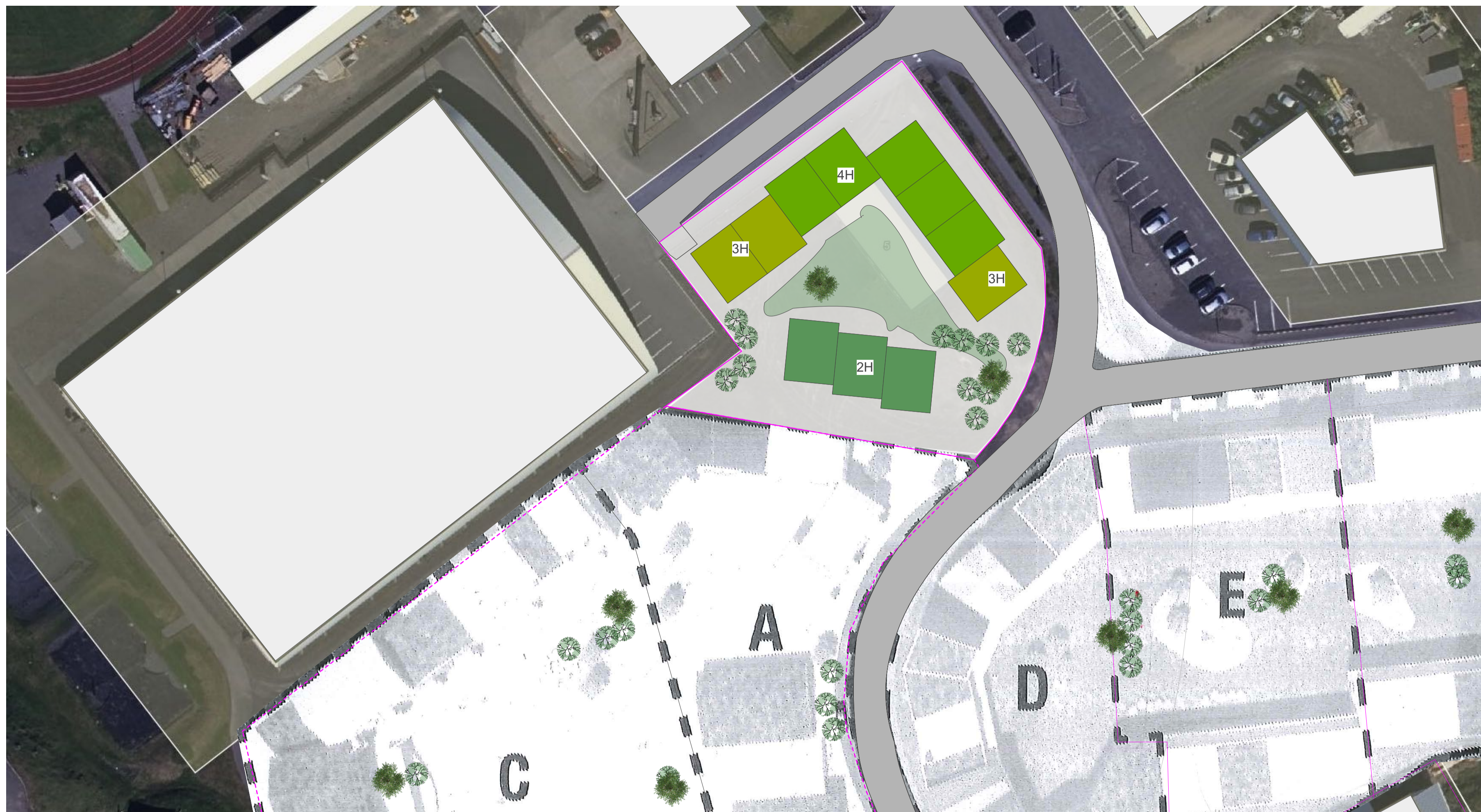
1 FRUMDRÖG Scale: 1:500

byggingarmagn: 2800m2 lööð skv. bæjarvef Hafnar: ca. 2600m2 NHL: 1,08